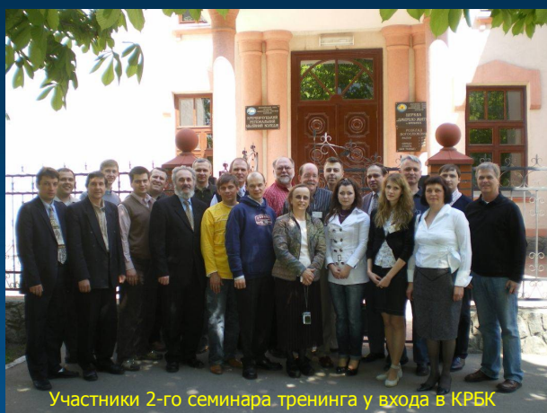
Участники 2-го семинара-тренинга у входа в КРБК

28 апреля -1 мая 2010 г. в помещении Кременчугского регионального библейского колледжа ( http://www.krbc.net ) прошел 2-й семинар-тренинг для преподавателей интерактивного дистанционного обучения. В семинаре приняли участие 28 преподавателей из 16 богословских школ, а также некоторые члены Совета ЕААА. Всего в семинаре участвовало 42 человека. Со стороны западных партнеров ЕААА семинар проводили Джордж Лоу, Том Дебби Вуд, Ден Мак-